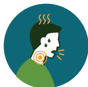
Dor de garganta