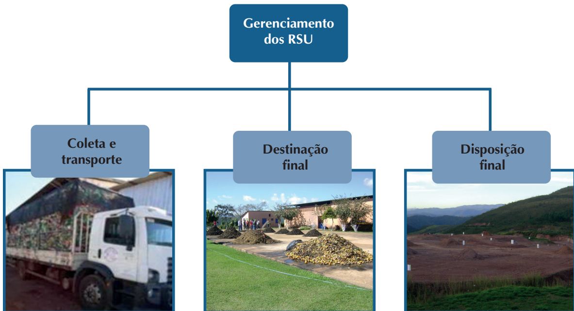
Figura 2 – Gerenciamento dos Resíduos Sólidos Urbanos.

A Política Nacional de Resíduos Sólidos (PNRS) define que o gerenciamento dos resíduos sólidos é um conjunto de ações exercidas, direta ou indiretamente, nas etapas de coleta, transporte, transbordo, tratamento e destinação final ambientalmente adequada dos resíduos sólidos, e disposição final ambientalmente adequada dos rejeitos, de acordo com o Plano Municipal de Gerenciamento Integrado de Resíduos Sólidos – PMGIRS, exigido na forma da lei.