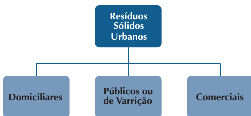
Figura 1 – RSU – Objeto de ações passíveis de repasse de recursos no Programa de Resíduos Sólidos da Funasa .

Ou seja, são passíveis de apoio deste programa as ações de Gerenciamento de Resíduos Sólidos de responsabilidade e titularidade pública.