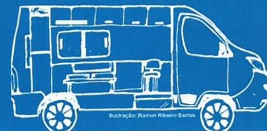
Ilustração: Ramon Ribeiro Barros

UNIDADE MÓVEL DE CONTROLE DA QUALIDADE DA ÁGUA